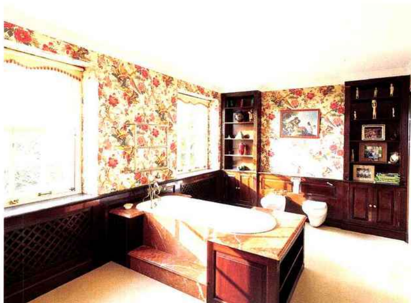
L'UNE DES 4 SALLES DE BAINS DE LA MAISON PRINCIPALE. ONE OF THE FOUR BATHROOMS IN THE MAIN RESIDENCE.