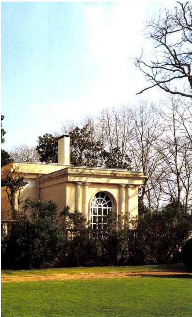
LA MAISON SURPLOMBE UN PARC DE 7 700 M 2 . THE MANSION OVERLOOKS A 7,700 SQ M PARK.