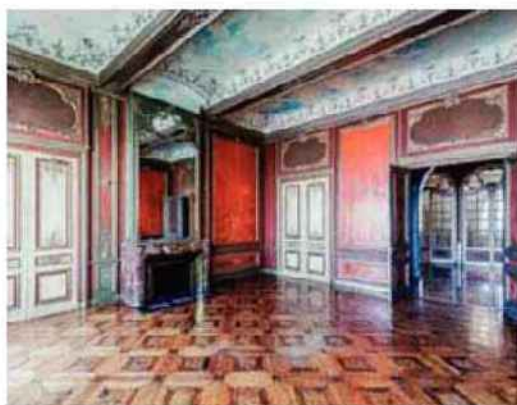
Appartement de réception du XIX e siècle

à la vue dégagée, sans oublier les Monts d'Or. En plus de leur emplacement privilégié, ils offrent tous des prestations exceptionnelles. Spécialiste de ce marché, le réseau des agences Primmo négocie même des ventes, en front de parc, dans les hôtels particuliers du boulevard des Belges, dont le prix au mètre carré peut atteindre 12 000 ou 13 000 €/m 2 . « À ce prix-là, les clients recherchent le zéro défaut, détaille Yves Mettetal, responsable de l'agence de Lyon 6 e . Il faut le bon étage, une belle entrée d'immeuble, un garage et des abords sécurisés. » Ces biens d'exception qui s'échangent jusqu'à plusieurs millions d'euros