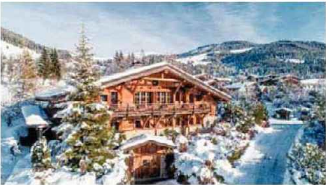
6,5 millions d'euros, c'est le prix pour 400 m² de luxe à Megève.

Le 20 mars à Londres, Sotheby's va proposer aux enchères une collection de vins très spéciale, parmi les plus rares et les plus fins, appartenant à la maison de luxe Cartier. Son président, Cyrille Vigneron, estime que le moment est venu de partager cet « art de vivre enivrant ». Le résultat de l'adjudication ira intégralement au profit de la Cartier Philanthropy Foundation, qui vient en aide aux femmes et aux enfants dans les pays les moins développés. C'est la première fois que Cartier propose cette entrée dans l'univers secret de ses caves. Chacune des bouteilles se verra estampillée pour attester de sa provenance. La collection présentera 250 lots, comprenant quelque 2 000 bouteilles, pour un total combiné de 250 000 livres sterling. Vous trouverez une gamme exceptionnelle de bordeaux parmi les châteaux légendaires, y compris les millésimes marquant des moments historiques et des années mémorables, mais aussi des bourgognes, dont des grands crus du Domaine de la Romanée-Conti ou du Domaine Faiveley, des champagnes et des cognacs.