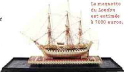
La maquette du London est estimée à 7000 euros.

Les 28 et 29 mai, une année après la disparition du célèbre conteur qu'était Pierre Bellemare, la maison de ventes Ferri racontera à sa manière « une incroyable histoire » avec la dispersion de sa collection, celle de la passion d'un homme pour l'art populaire et les objets du quotidien, autant de témoins discrets du passé. Dans l'inventaire, nous remarquons ainsi une superbe maquette du célèbre vaisseau trois ponts le London , armé de 100 canons, en bois, ivoire et os. L'estimation, 7000 euros, est à la hauteur du caractère exceptionnel de cette belle reproduction. On comprend aussi que ce professionnel des médias très pointilleux soit tombé amoureux de ce minutieux travail de sculpture d'un haut relief de navire, daté xviii e siècle (estimé 1500 euros), ou de cette râpe à tabac armoriée en bois, très finement sculptée (1500 euros), ou encore de cette boîte à sel figurant une poule en noyer sculpté, du début du xx e siècle (300 euros). Impossible de vous confier les 500 histoires des 500 objets présentés dans cette vente, Pierre Bellemare aurait pris tant de plaisir à le faire.