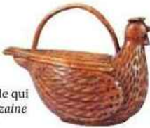
À gauche: boîte à sel (300 euros). Ci-dessous: moule pour cire votive (300 euros).

souvent que péniblement à s'en sortir! L'Autorité des marchés financiers (AMF) a mis en garde contre cette nouvelle fraude qui se développe. « Nous n'avions eu qu'une dizaine d'appels d'épargnants sur ce sujet en 2018. En 2019, nous en avons déjà reçu une cinquantaine », alerte Claire Castanet, directrice des relations avec les épargnants à l'AMF. Une montée en puissance qui inquiète, puisque les détournements déclarés avoisinent les 14 500 euros. Toute offre de placement doit être préalablement enregistrée auprès des services de l'AMF, or aucune des nombreuses sociétés proposant cette « opportunité » ne s'est fait connaître. En outre, tout est mensonger, l'épargne collectée n'est pas investie. Après les escroqueries en « terres rares », en diamants, en manuscrits historiques, en bitcoins, en « options binaires », en containers... les escrocs surfent maintenant sur le bio et les aides de la politique agricole commune!