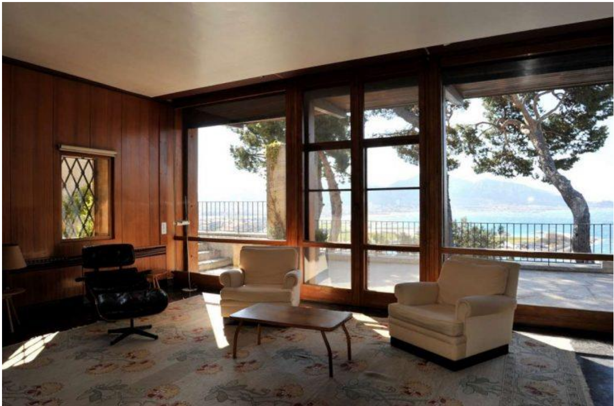
Salon ouvrant sur les terrasses.

L'étage est composé d'un hall moderne, d'une triple réception avec accès aux jardins et aux terrasses avec vue sur mer, d'un bureau, d'une chambre parentale avec terrasse, d'une salle de bain et d'un dressing ainsi qu'une cuisine donnant sur un patio à claustra. Une cheminée avec foyer est également présente à cet étage.