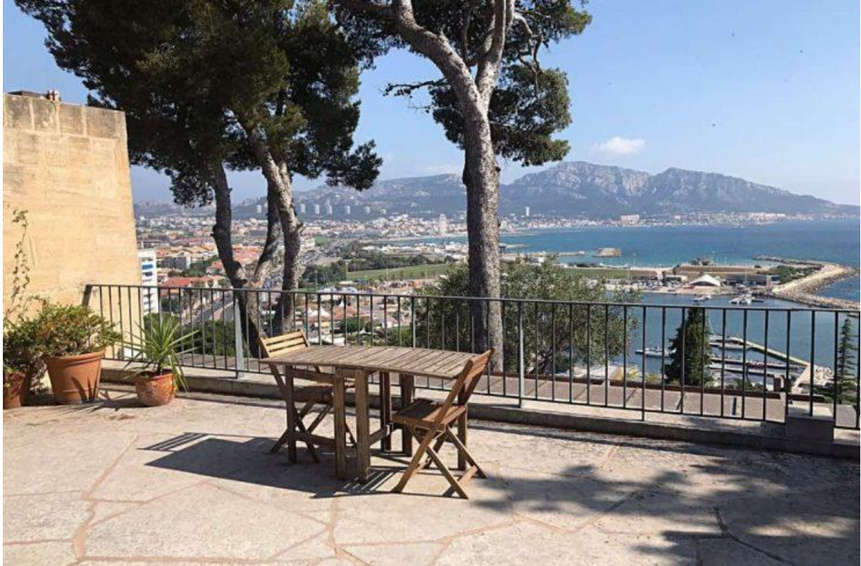
Terrasses de la villa avec vue sur les plages du Prado.

un terrain de 3200 m 2 du Parc Talabot, un espace créé à la fin des années 1850 sur la colline du Roucas Blanc par Paulin Talabot, un industriel et financier qui a notamment participé à la création du Crédit Lyonnais, de la Société Générale et de la compagnie de chemin de fer Paris-Lyon-Méditerranée. Le parc a notamment été le lieu de vacances du couple Macron en août 2018. Un lieu très prisé des vacanciers avides de luxe et de tranquillité.