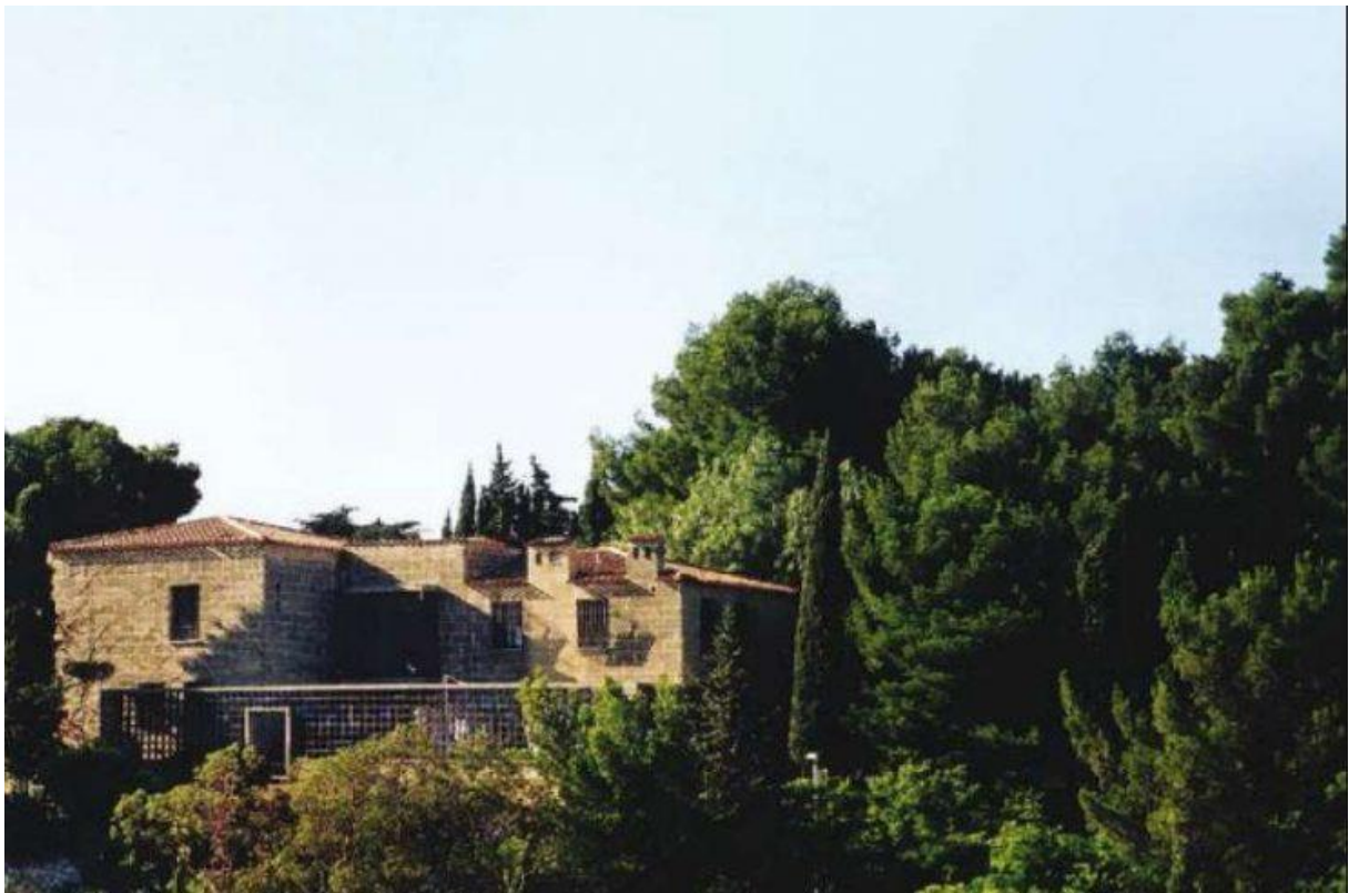
Extérieur de la villa de René Egger.

La villa s'inscrit dans la tradition marseillaise, ses façades nord et est sont destinées à protéger du mistral et ses façades sud font office de terrasses avec vue sur les plages du Prado.