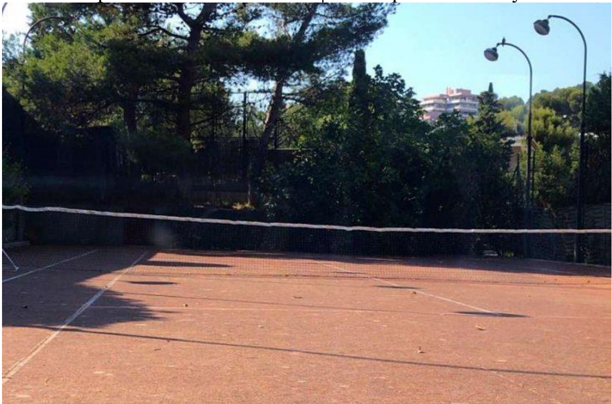
Court de tennis de la villa. | Crédit photo : Joffray Vasseur

Au total, cette propriété d'exception comprend 10 pièces à vivre dont 6 chambres, 2 salles de bain et 3 salles de douche. Elle a été bâtie sur